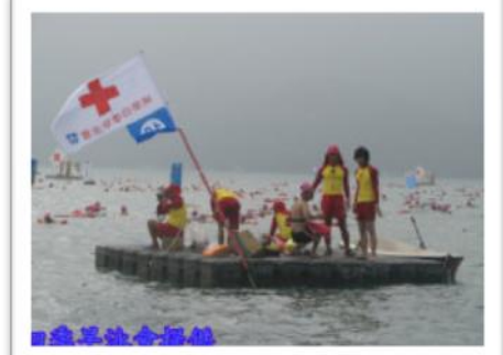
浮板上辛苦的補給工作人員