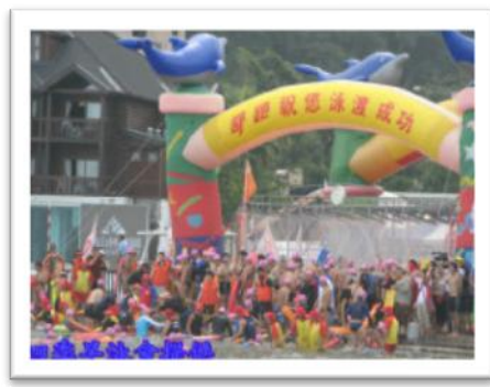
泳渡終點站德化社