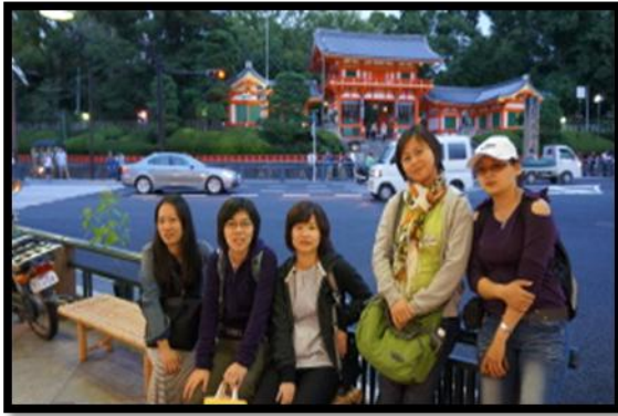
趕及進去的八坂神社(他們也是 5 點下班的)