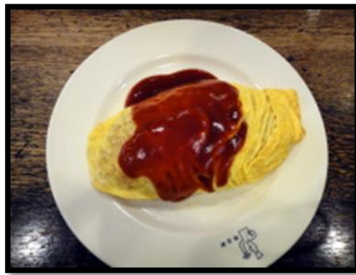
不便宜但茄醬是鹹的好吃蛋包飯