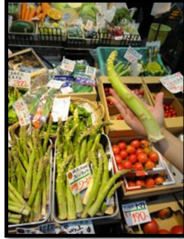
黑門市場裡的超級大蘆筍