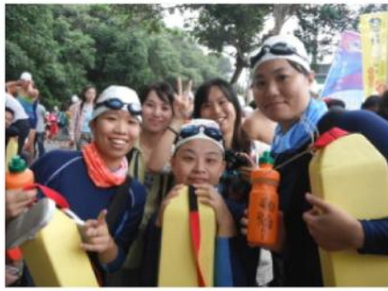
第一批準備下水的泳士