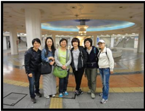
第一天下飛機就迷路的梅田站-泉之廣場