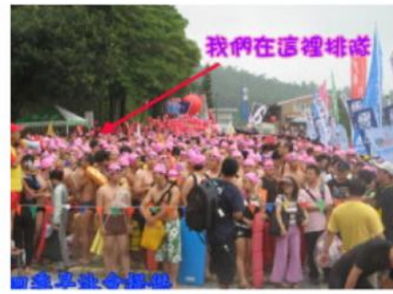
被擠在帳棚邊無法繼續前進和隊長會合