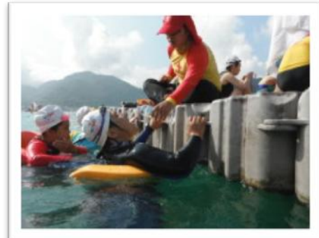
來啱~嘴巴打開餵食囉