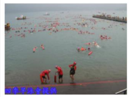
第一批下水的水域果然格外清爽