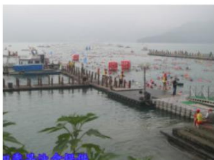
泳渡的出發地點朝霧碼頭