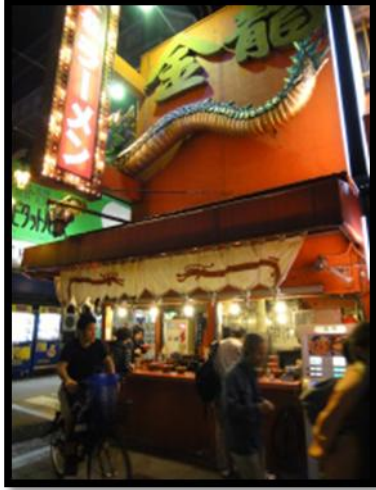
必須站著吃的拉麵攤