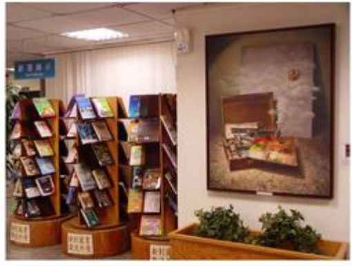
▲ 新書展示旁的「哀悼自由」