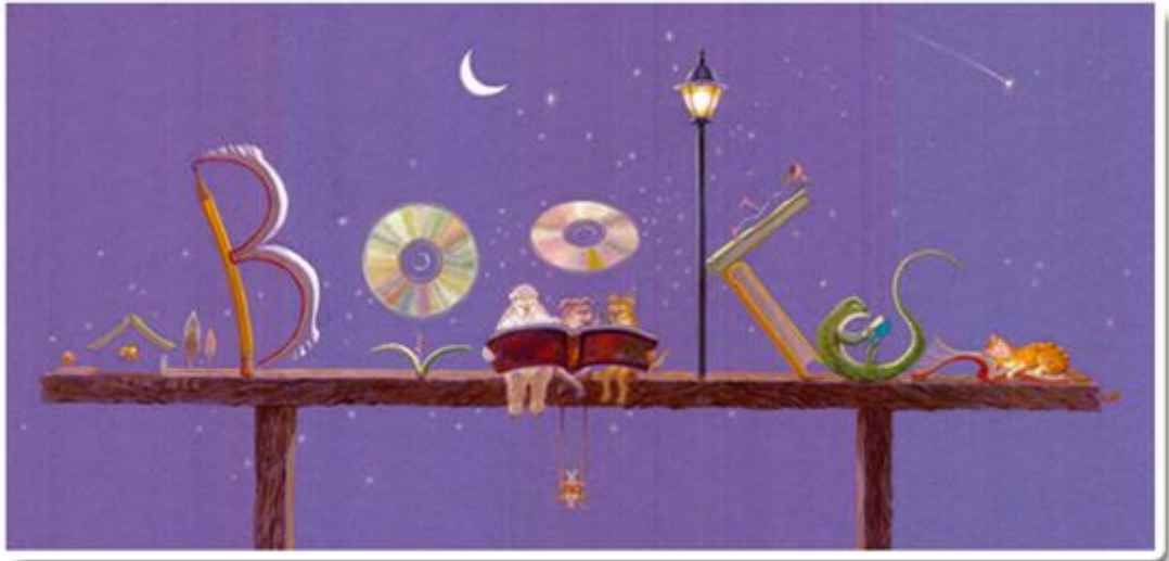
▲ 《有一片光》 水彩插畫/2010 徐素霞