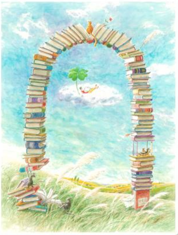
▲ 《有一扇門》 水彩插畫/2010 徐素霞

「有一扇門」是由書本搭建而起，這道通往知識之門，你算算看一共有幾本書呢？還有，奇怪的是？老鼠不偷糧偷書去了，貓咪也不玩抓老鼠的遊戲，安安靜靜的看起了書，因為書，因為閱讀，牠們竟然能和平共處？..這..是..知識