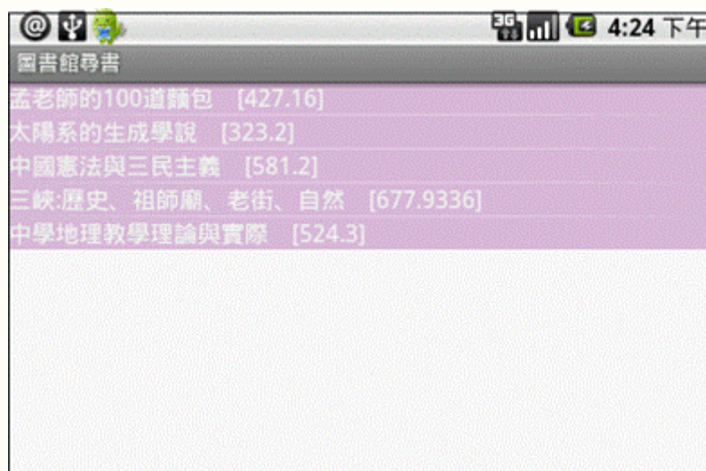
圖三 借書清單畫面

使用者在手機拍攝解碼後，在手機中會自動建立一個借書清單，如圖三所示，在借書清單建立完成後，使用者即可前往圖書館進行尋書與借閱。