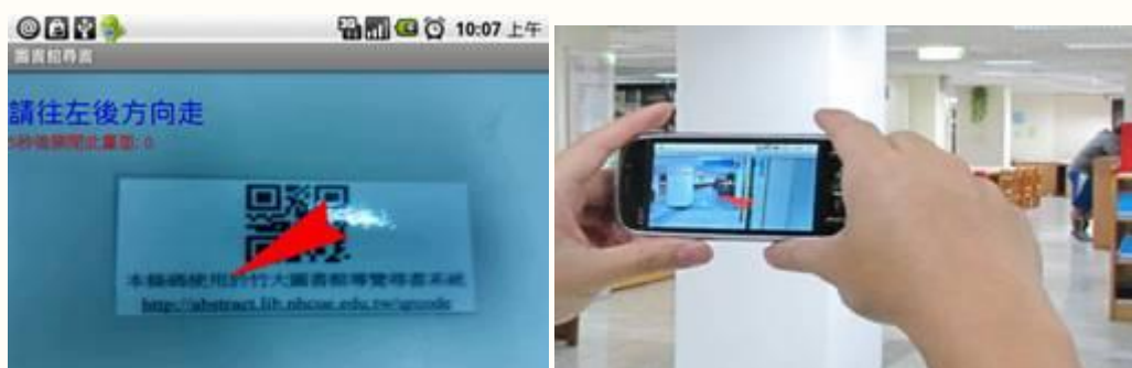
圖四 手機指引方向圖

使用者在進入本館，可發現到館內的柱子皆貼有二維條碼，使用者可利用手機拍攝解碼館內的任何一個二維條碼，手機會根據使用者目前的所在位置，指引使用者借書的方向，如圖四所示，透過手機所指引的方向，可以提供使用者參考，以便使用者可以更快速的找到要借閱的書籍。